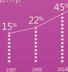
График роста успешности ЭКО в ИРМ